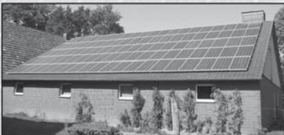
Beratung Planung und Installation von Photovoltaikanlagen