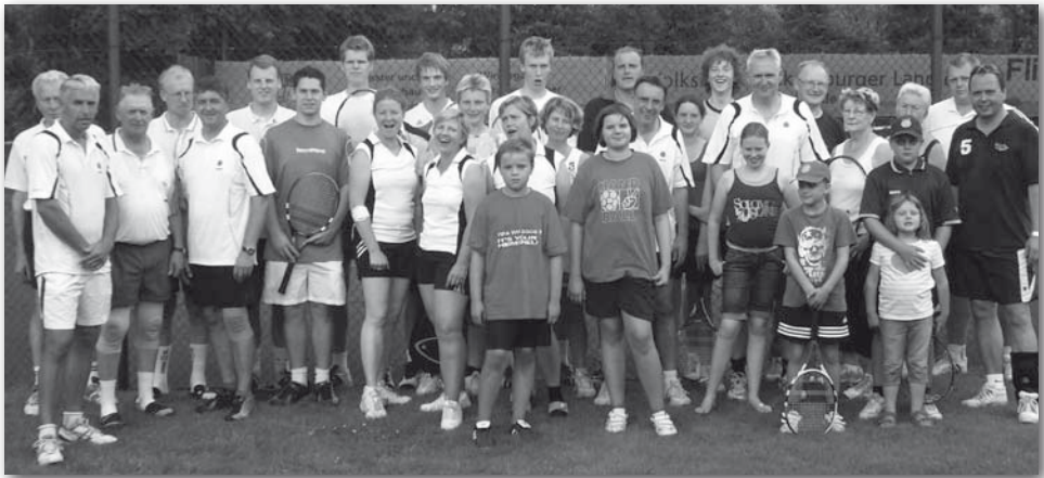
Zwischen Frühstück, Tennisspielen und Grillen war noch Zeit für ein Foto