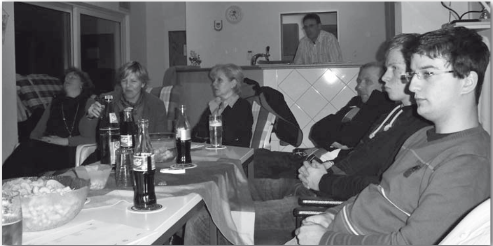
So sieht konzentriertes Arbeiten und Zuhören aus!