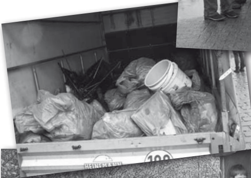
Diese Kinder halfen mit beim Müllsammeln.