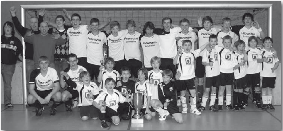
Sieger beim „Internen Turnier“