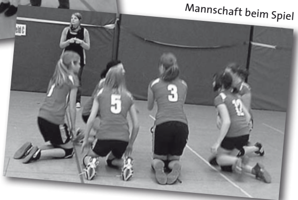
Mannschaft beim Spiel