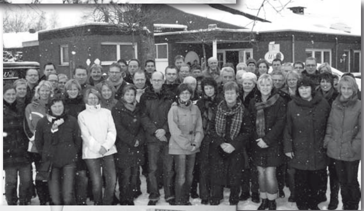
Diese Erwachsenen absolvierten das Sportabzeichen