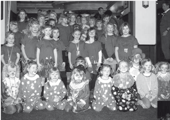
Die Powerzicken und die Powergirls