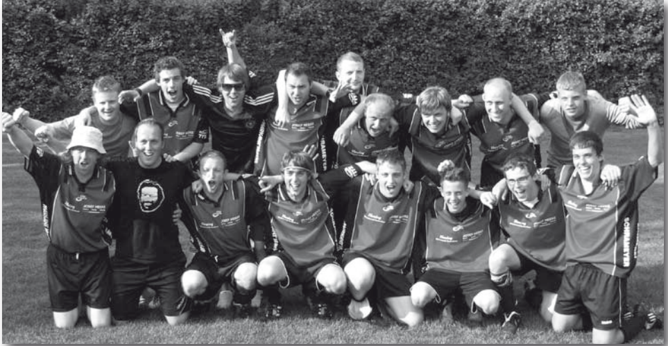
1. Sieger Fastnachtsturnier: Up'n Sande

angeboten. Dazu lachte die Sonne. An den Pfingsttagen war es einfach schön am Sportplatz zu sein.