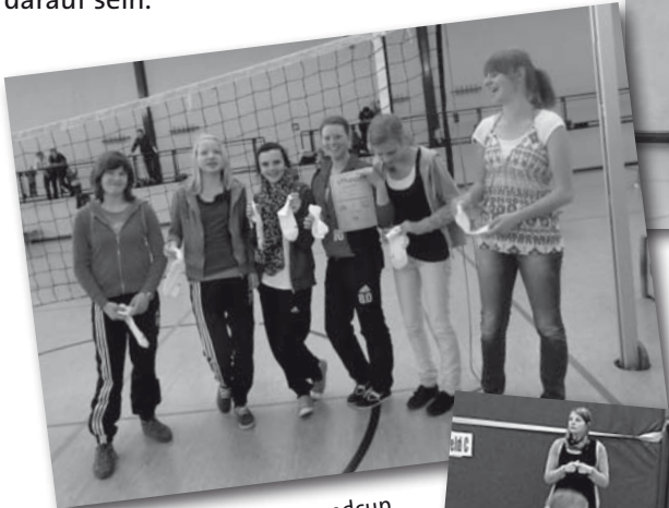
Siegerehrung beim 7. Jugendcup

Dieses kann auch die gesamte Mannschaft auf die Saison sein. Die Mannschaft stand die gesamte Zeit der Saison im oberen Teil der Tabelle, letztendlich wurde es ein guter dritter Platz.