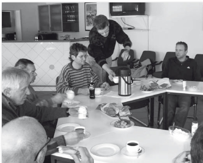
Gestärkt geht's wieder an die Arbeit. Auch hier vielen Dank allen Helfern.

Gleichzeitig fanden die Anmeldungen für die Vereinsmeisterschaften 2010 statt. Die Anmeldefrist war am 30.05.2010 zu Ende. Die Auslosung fand am gleichen Tag statt. Gespielt wird in folgenden Gruppen: Herren / Herren 40, Herren Doppel in zwei Altersklassen, Damen, Damen Doppel und Mixed. Hoffentlich sind die Anmeldungen so zahlreich, so dass alle Gruppen gespielt werden können.