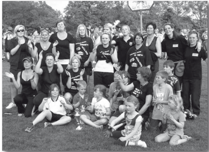
1. Sieger „Spiel ohne Grenzen“: Up'n Sande

Die 10 verkleideten Personen, die ebenfalls Samstagnachmittag auf dem Gelände mehr oder weniger versteckt herumliefen, mussten von den Kindern gesucht werden. Einige wie Schotte und Kuh waren sehr leicht zu finden. Schwieriger wurde es dann schon mit dem Arzt und dem Penner. Aber die Kinder hatten viel Spaß beim Verkleidungsspiel.