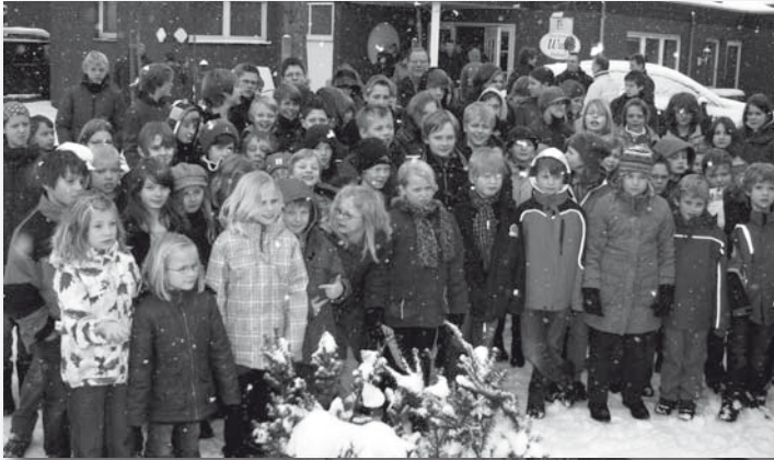
Diese Kinder und Jugendlichen absolvierten das Sportabzeichen.