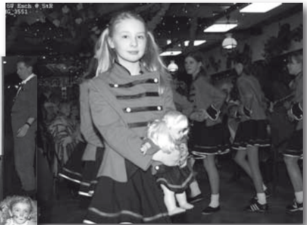
Nie ohne Maskottchen