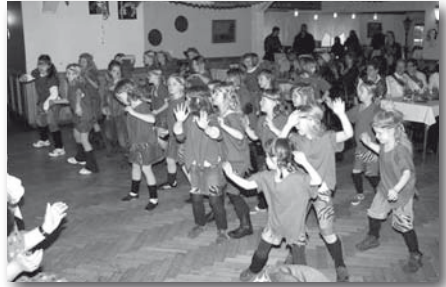
Der Dschungel ruft