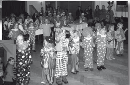
Clowns in der Manege