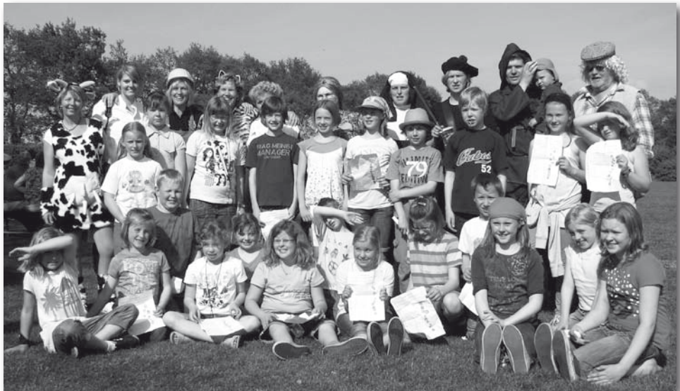
Alle Teilnehmer des Verkleidungsspiels

Das Spiel Haubentauchen machte nicht nur den Teilnehmerinnen Spaß auch die Zuschauer fanden es lustig, wie die Köpfe in den mit Wasser gefüllten Eimern verschwanden. Gaumenschmaus wurde in vielfältiger Weise für Groß und Klein