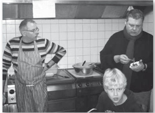
Hhmm, einfach lecker...