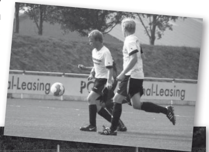
Die Defensive im Einsatz