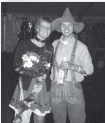
Miss und Mister Oktoberfest 2009