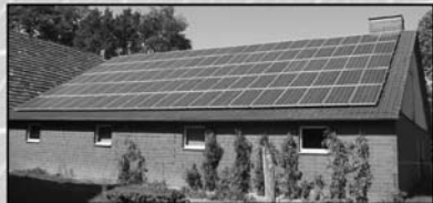
Beratung Planung und Installation von Photovoltaikanlagen

Anmeldung und Unterricht: Di. und Do. um 19:00 Uhr (an der Kirchstraße 2 in Püsselbüren)