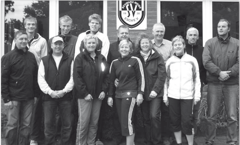
Alle Sieger und Finalisten auf einen Blick

Nach den Spielen war die Stimmung sehr gut, da auch die Geselligkeit nicht zu kurz kam und alle Spieler und Zuschauer zusammen die Siegerehrung mit Getränken und leckerem Grillfleisch feierten. Alle stellten sich gern zu einem Gruppenfoto bereit.