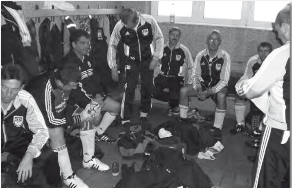
Blick in die Siegerkabine der Ü40, vor dem Spiel