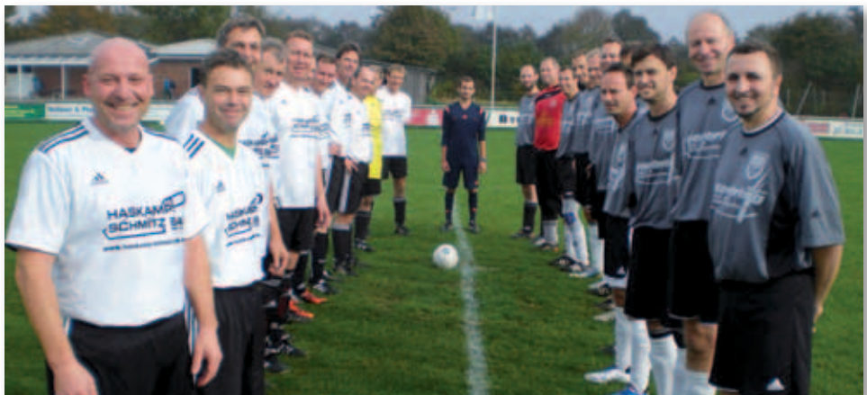
Links die ü40, rechts die ü32